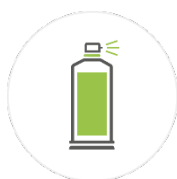
AÉROSOL 650 ml